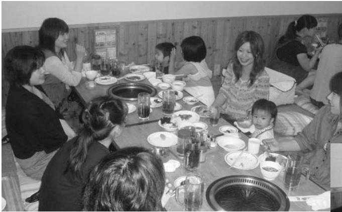
奥さん方も話が弾みます

青年部計根別支部では八月三十日、中標津町ウエスタンで総勢五十名の参加で家族親睦会を開催しました。 久しぶりに合わせた顔もあり、和気あいあいとした雰囲気の中、思い思いの話題と食材を楽しんでいました。これから始まる二番草の収穫を前に鋭気を養った夜でした。