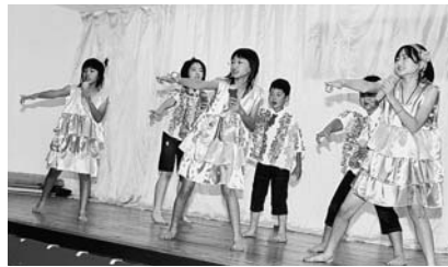
「陽はまた昇る」計根別地区