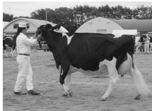
昨年に続き全道出場となるビーナスルキア号

根室管内で飼養されるホルスタインの体型の美しさを競う、平成二十年根室ホルスタイン共進会(根室生産連等が主催)が八月二十四日、中標津町のホクレン根室地区家畜市場で開かれ、一八一頭が出品されました。当農協では十八戸から管内最多の三十九頭を出品し頂点を目指しました。