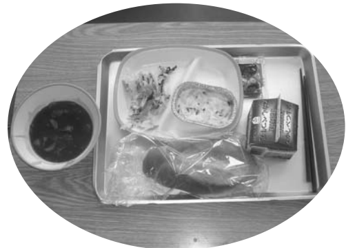
当日のメニュー、右上の小袋がミルクジャム

の出産シーンを写した映像には子どもたちも真剣に見入っていました。 また、牛肉編では肉用に向けた雄子牛や枝肉部位についての説明や、市販のパックに印字される個体識別番号により生産履歴が確認できることなども解説し、子供たちの興味を誘っていました。 メンバーは子どもたちに「牛乳や牛肉を食べることは牛の命を頂くことであり、みんなの給食になるまでも多くの方が関わっています。感謝の気持ちを持っておいしく残さずに食べましょう」と呼びかけると、子どもたちから「ハイ！」と元気な返事が返っていました。