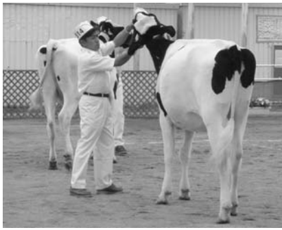
全道常連のハイエストファーム出品牛 マックプレッツエル号