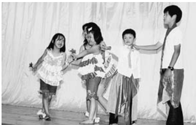
「陽はまた昇る」旭会