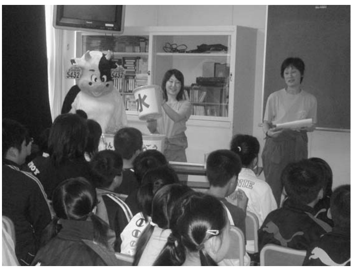
実際のエサや牧草を用意し説明するメンバー

し、グラタン、ダイコンサラダ、中標津牛乳の五品です。グループは五・六年生三十九人を対象に、食材の牛乳や牛肉の製造過程についてスライドや実際の牧草、配合飼料などを使って分かりやすく講義しました。 講座は、「牛乳編」と「牛肉編」の二本立て。牛乳編では、酪農家での乳牛の育成から搾乳に至る飼養管理などについて細かく説明。乳牛