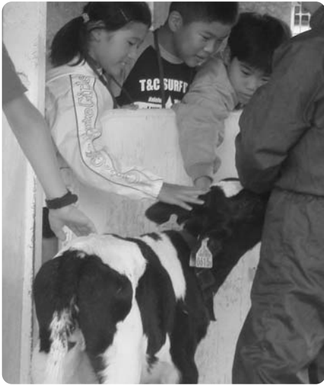
「かわいい!」と子牛に手を伸ばす子供たち

また、翌日には農協モアン牧場でフットパスを体験。都会では味わうことのできない広大な景色を見ながら四・六kmのコースを元気に歩きました。同キャンプは、中標津町と川崎市の友好都市交流事業として毎年実施されているもの。学校訪問や食品加工センターでの乳製品加工、養老牛での溪流釣りなども行われました。