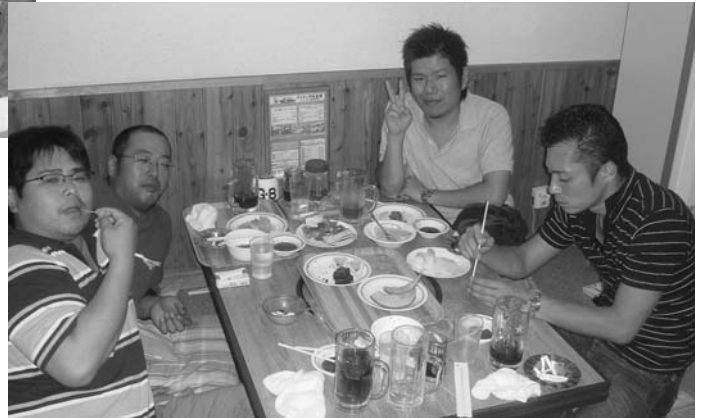
おなか一杯となり「もう満足です」

青年部計根別支部では八月三十日、中標津町ウエスタンで総勢五十名の参加で家族親睦会を開催しました。 久しぶりに合わせた顔もあり、和気あいあいとした雰囲気の中、思い思いの話題と食材を楽しんでいました。これから始まる二番草の収穫を前に鋭気を養った夜でした。