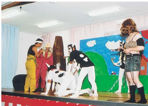
宵宮での計根別地区青年の迷演技