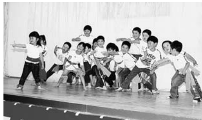
「陽はまた昇る」東会