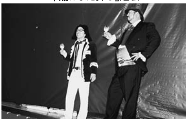
計根別地区の劇中で「ルネッサンス！」