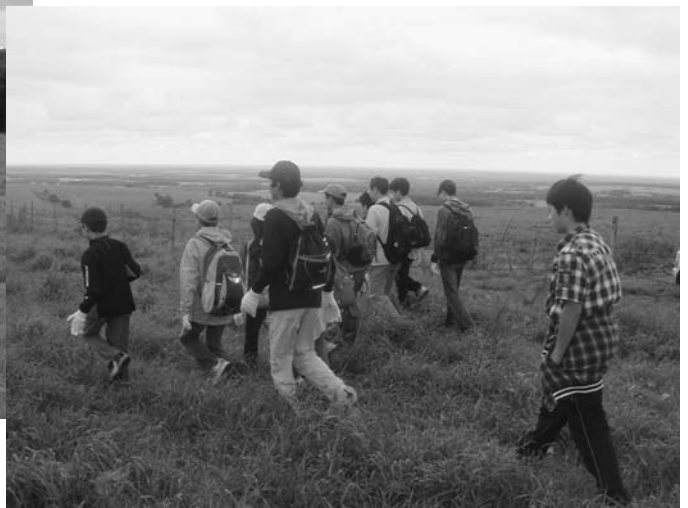
地平線や広大な景色に圧倒されながら…