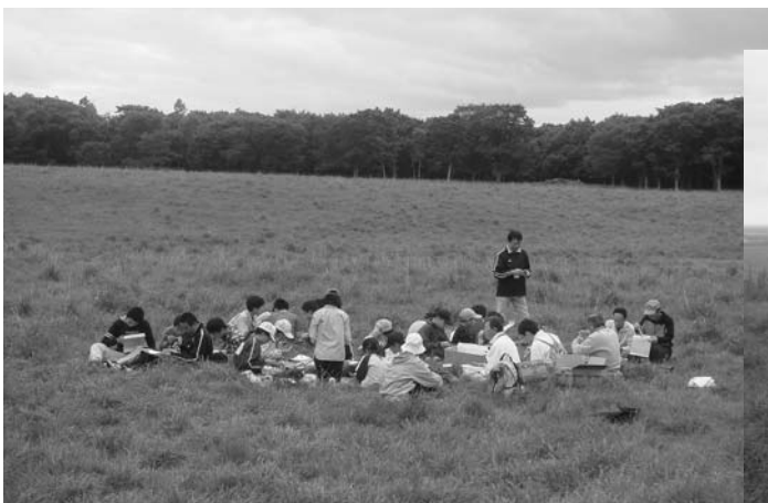
牧場に腰をおろし、弁当を広げます