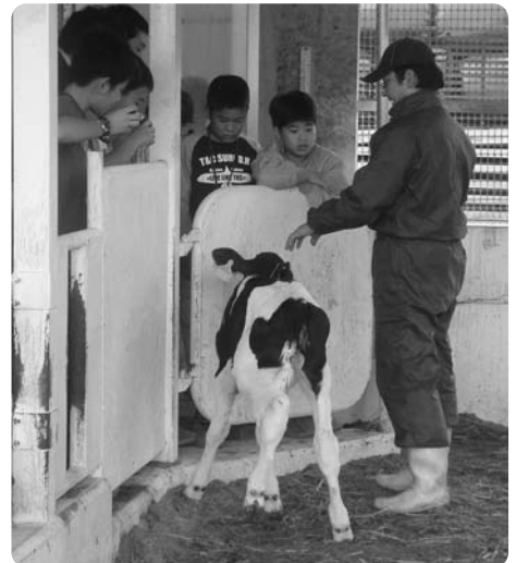
子牛育成法の説明を聞きます