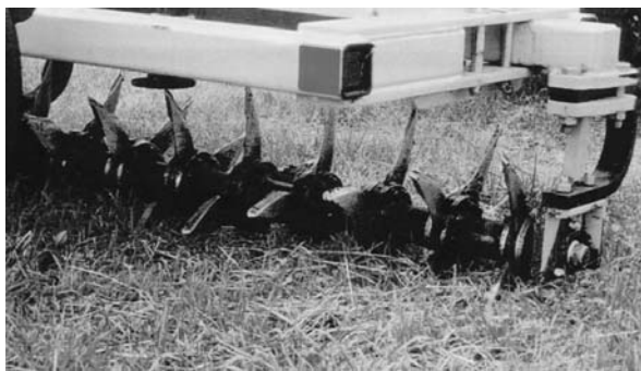
写真1 エアウエイ（刃が土中に入り込んだ状態）

*代替量は堆肥からの成分を単肥で置き換えた場合の量を示した *削減額は各代替量に1袋当たりの価格を硫安1,000円、ダブリン3,000円、塩加2,000円に設定し削減可能額として求めた。